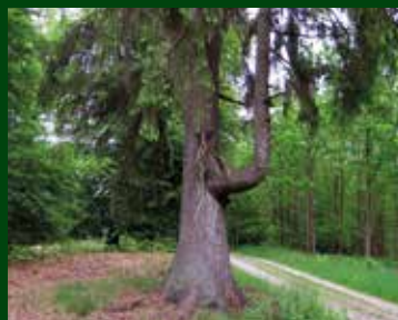
Post 2: Træet