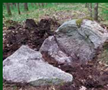
Post 3: Rillestenen