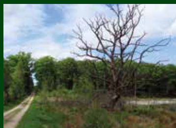
Post 4: Træet i vådområdet