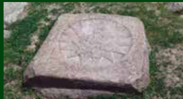
Post 1: Kongestjernen

Teksten læses højt for alle. Posterne er ikke markeret. De har særlige kendetegn, som I skal finde ved hjælp af kortet samt foto af hver post nedenfor.